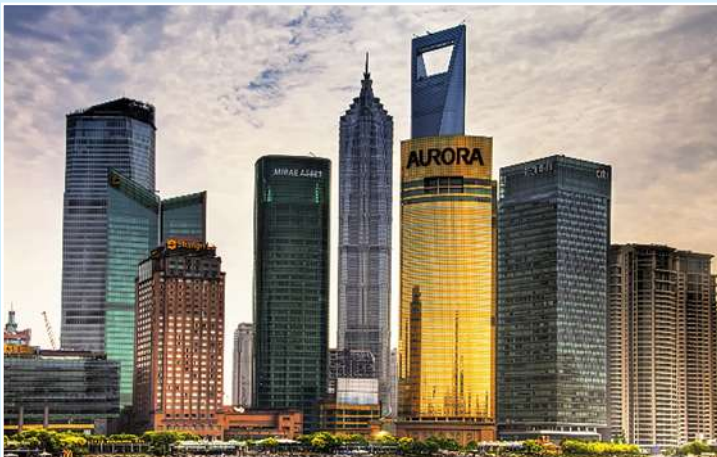
Nelle strutture moderne ad elevato sviluppo verticale i sistemi SHM vengono previsti a livello progettuale. Modern tall building designs include SHM systems.

L’implementazione di una strategia di rilevazione dei danni strutturali nei settori dell’ingegneria civile, meccanica e aerospaziale viene definita “Structural Health Monitoring” (SHM) e può venire tradotta come “monitoraggio della integrità delle strutture”. Una strategia di SHM richiede l’osservazione della struttura durante un certo intervallo di tempo durante il quale effettuare misure che consentano di dedurre la presenza di eventuali danni. Procedure statiche di questo tipo vengono applicate da molto tempo e sono essenzialmente basate sulla rilevazione, mediante opportuni sensori (estensimetri) delle variazioni che possono subentrare e nella geometria di una struttura.