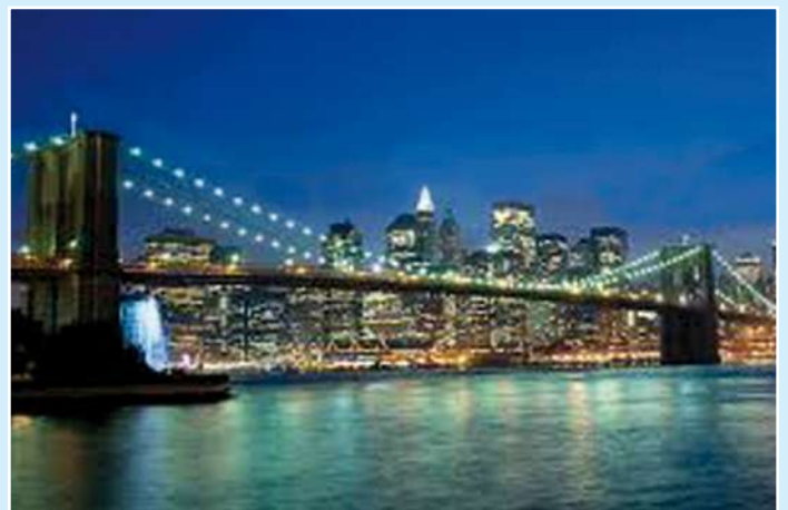
Molti ponti (in figura quello di Brooklyn) hanno più di un secolo di vita. Many bridges, like the Brooklyn one, are more than one century old.

Systems endowed with all previous features, like Teleco SHM602, can overcome most limits of traditional systems and implement all sensors necessary to get a complete situational awareness without reaching prohibitive costs. The possibility of installing an high number of sensors over the same bus greatly simplifies the installation also in old buildings where severe rules concerning the installation of new hardware are present.