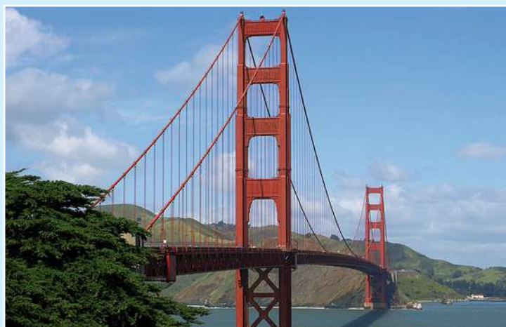
I ponti costituiscono le strutture più frequentemente monitorate mediante sistemi SHM. Bridges are frequently monitored by means of SHM systems.

The evaluation of damages to bridges and buildings on the basis of acceleration measures dates back to the '80. The modal properties and associated parameters (like the matrix of dynamic flexibility indices) have been the first information used in the evaluation of bridge faults.