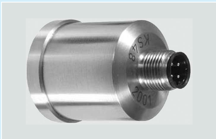
Un tipico accelerometro piezoelettrico usato nei sistemi SHM tradizionali. A typical piezoelectric accelerometer used in traditional SHM systems.

Qualunque struttura produttiva, privata o pubblica, è interessata ad individuare il prima possibile i difetti e i danni presenti nei suoi prodotti o nelle sue infrastrutture, sia per motivi economici che di sicurezza operativa degli impianti e questo richiede l'uso di metodologie SHM. Nel settore dell'ingegneria civile l'applicazione di tecnologie SHM consente una valutazione affidabile dei danni subiti dalle strutture sottoposte ad eventi sismici e quindi di determinare se è possibile riutilizzare in condizioni di sicurezza un edificio dopo un terremoto. La rapida riutilizzazione degli edifici destinati ad attività produttive può ridurre in maniera significativa i danni economici causati dai terremoti, quella degli edifici pubblici può ridurre sensibilmente i disagi sociali.